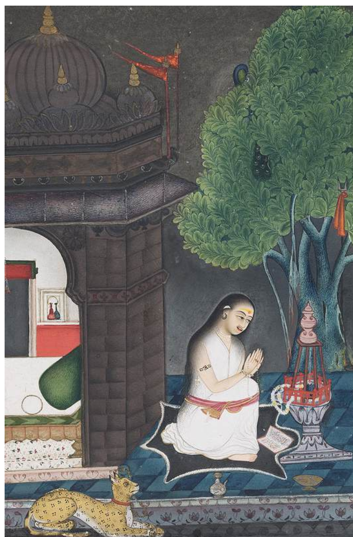
Maestro Kota non ancora identificato, Bangala Ragaputra, figlio di Raga Hindola, foglio dalla "serie Kota Narayana Ragamala", Kota, ca. 1770, pittura a pigmento su carta, collezione privata, Zurigo

Il Museo Rietberg di Zurigo è uno dei più grandi musei d'arte della Svizzera, con un patrimonio di collezioni di fama internazionale, che comprendono importanti opere provenienti da Africa, Americhe, Asia e Oceania. A partire da questo mese di gennaio 2026 e fino al 10 maggio, una mostra straordinaria presenta opere significative della collezione di pittura indiana e della collezione di fotografia. L'obiettivo dell'esposizione - si legge nella presentazione ufficiale nel sito web del museo - è illustrare l'importanza del ruolo del colore nell'arte indiana.