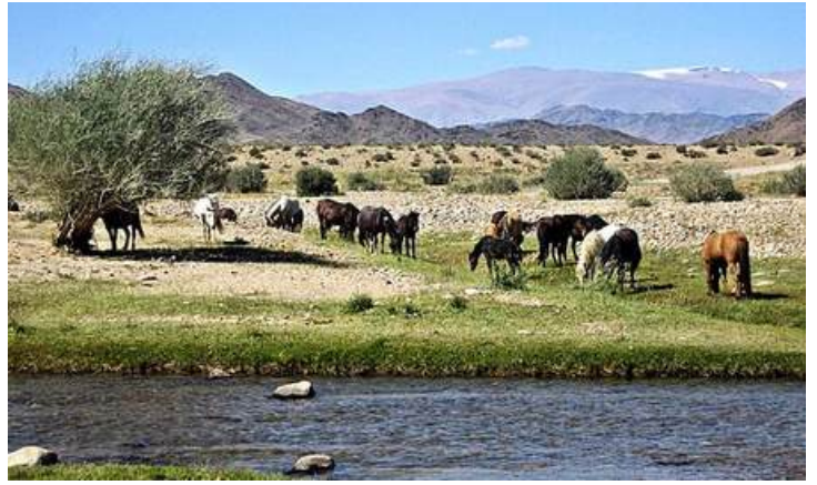
Cavalli al pascolo in Mongolia

Il cavallo non fu solo mezzo di trasporto, ma anche uno dei beni più ambiti che viaggiavano lungo la Via della Seta. La fascinazione cinese per i cavalli risale al 125 a.C., quando Zhang Qian tornò dalla sua missione presso gli Yuezhi. Una missione che definire 'epica' è riduttivo. Oltre agli arcinemici Xiongnu, presso cui rimase ospite prigioniero per dieci anni, l'emissario imperiale ebbe modo di incontrare diversi popoli allevatori di cavalli come i Wusun o gli stessi Yuezhi. Il popolo che tuttavia cambierà il rapporto tra la Cina e i cavalli fu quello dei Dayuan, nella Valle di Ferghana. Erano loro ad allevare la razza di cavalli definiti "celesti" e ritenuta di origine divina. Si trattava della razza equina argamak, entrata nella mitologia cinese per il suo "sudare sangue", fenomeno spiegato oggi dal parassita Parafilaria multipapillosa . L'interesse per questi particolari cavalli portò allo scoppio della "Guerra dei Cavalli Celesti" (104-102 a.C.) quando i Dayuan si rifiutarono di vendere i loro destrieri agli emissari dell'imperatore Han Wudi.