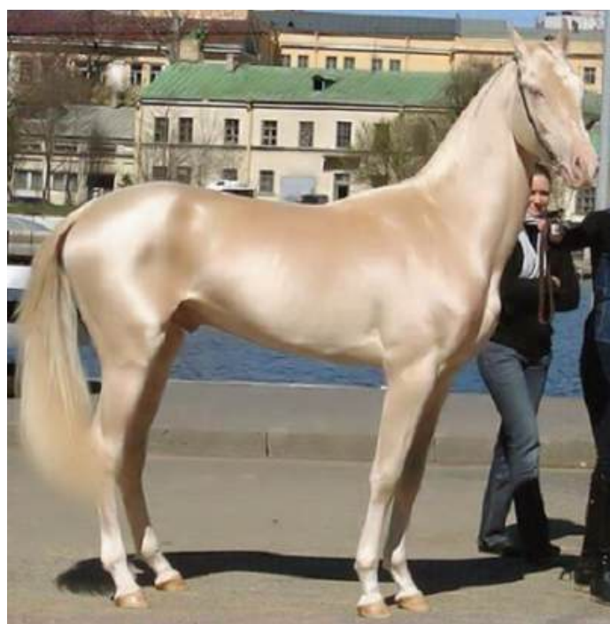
Uno splendido esemplare di Akhal-Teke

Il merchandising della Via della Seta ci fa ormai associare questo reticolo di vie commerciali al profilo di un cammello battriano che si staglia sullo sfondo delle dune di un deserto sabbioso. Questo è vero solo per alcuni tratti della Via della Seta. Uno di questi è il Taklamakan, il 'luogo da cui non si ritorna', noto per le tempeste di sabbia raccontate anche da Marco Polo. Lungo la maggior parte della Via della Seta, il mezzo di trasporto più usato era il cavallo. Un animale profondamente radicato nella storia e nella cultura cinese. Era a cavallo che le truppe di An Lushan posero una delle minacce più serie alla civiltà cinese. Ed era sempre a cavallo che principesse imperiali (o più spesso donne di rango meno elevato) raggiungevano i loro consorti sovrani di sperduti regni.