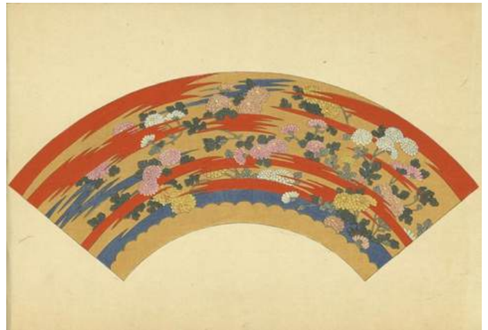
2 - Miyawaki Shinbei, Raccolta di disegni per ventagli per la vendita, volume 2, silografia policroma, Unsōdō, Kyoto, 1900 (Meiji 33) Biblioteca Civica di Varese - Immagine studiata per un ventaglio.

Questi libri di modelli, o "libri di design", venivano già prodotti fin dall'inizio del periodo Edo da numerosi editori nelle principali città di Kyoto, Osaka ed Edo e mostravano generalmente modelli decorativi per kimono ( hinagatabon ) stampati con la silografia monocroma. Si trattava di cataloghi di vendita per i commercianti del tessile, maneggevoli e trasportabili, oppure di manuali per tessitori e artigiani che riproponevano forme, colori e dettagli dei manufatti da confezionare. Venivano continuamente aggiornati per rispondere alle costanti