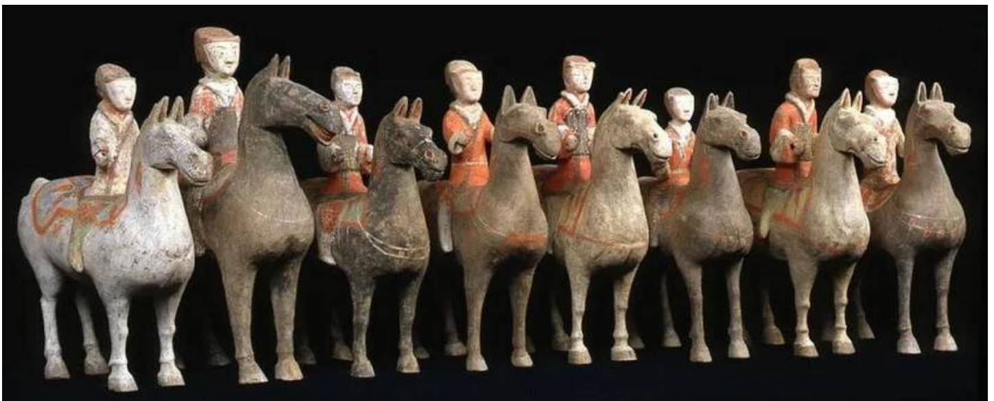
Cavalieri cinesi di epoca Han – L'introduzione della cavalleria montata in alternativa ai carri da guerra, fu decisiva nella lotta contro i popoli Xiongnu.

Dopo la vittoriosa campagna di Qianlong in Zungaria, il ruolo del cavallo lungo questa parte di Via della Seta cambiò molto. Il cavallo perse gran parte della sua importanza militare o sociale, restando tuttavia importante per agricoltura, commercio e trasporti. Siamo in ogni caso ormai lontanissimi da quando in Mesopotamia il cavallo fu a lungo guardato con estremo sospetto: un animale bizzarro ed esotico, mentre cavalcare un asino era ben più dignitoso agli occhi di tutti.