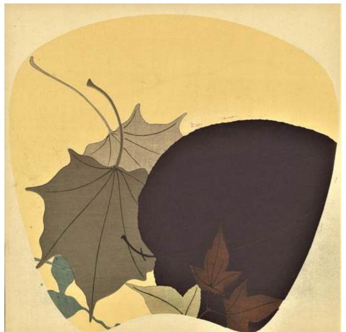
3 -Tsuda Seifū, Erbe estive (Natsugusa), silografia policroma, Unsōdō, Kyoto, 1904 (Meiji 37) Biblioteca Civica di Varese - Immagine studiata per un ventaglio.

richieste di modelli alla moda facilitando a loro volta l'incremento della domanda di nuovi capi d'abbigliamento e altri accessori.