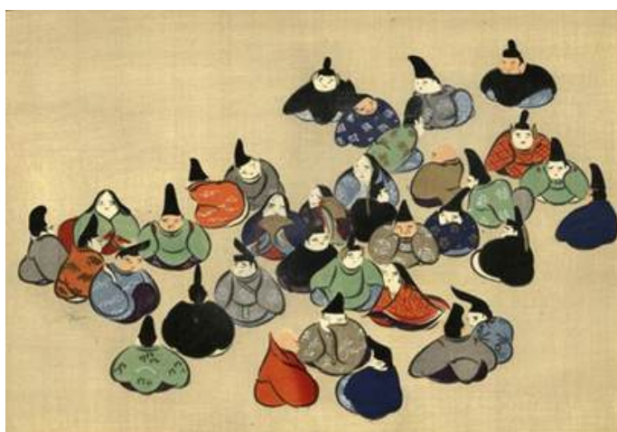
5 - "I trentasei poeti immortali", Kamisaka Sekka, illustrazione 23 x 35 cm circa, Mille erbe [Cose di tutti i generi] (Chigusa), volumi 1 e 2, silografia policroma, Unsōdō, Kyoto, 1903 (Meiji 36) Biblioteca Civica di Varese.

rivista "Bijutsukai" del suo allievo Furuya Kōrin, le vivaci pagine di Shasei sōka moyō e i noti motivi decorativi Kōrin moyō, ma anche i modernissimi Kamonfu e Senshoku zuan di Tsuda Seifū, e i volumi di Ogino Issui, Hasegawa Keika e molti altri artisti, lasciano trasparire tutte le sperimentazioni nate sulla spinta delle impressioni ricevute dall'arte occidentale, e allo stesso tempo fanno emergere la tendenza alla semplificazione del disegno che doveva essere agevolmente riproducibile tale e quale o di ispirazione su diversi materiali e forme.