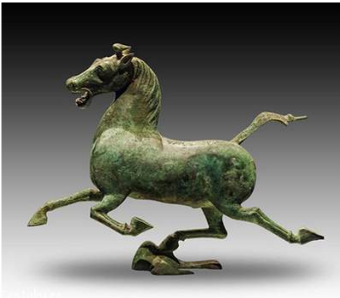
Cavallo del Fergana – Bronzo, Epoca Han

I cavalli furono per secoli un elemento centrale negli scambi tra nomadi delle steppe e società sedentarie. Quel confine mobile tra due mondi così diversi ha molto da raccontare. Come tutte le zone grigie, fu spesso vista con sospetto, troppo poco irreggimentabile, tanto da portare alcuni studiosi come Arthur Waldron a sospettare che un'opera come la Grande Muraglia fosse parte di un più complesso progetto di costruzione identitaria. Da un lato la Cina, tramite gli intermediari sogdiani, otteneva cavalli per le truppe e i servizi di comunicazione. Dall'altro i capi nomadi ricevevano seta e beni di lusso, indispensabili per sostenere il proprio sistema clientelare. Come afferma lo storico Thomas Barfield, queste due società così diverse vivevano quasi in simbiosi, in un costante equilibrio che - da parte cinese - oscillava tra tentativi di incorporazione, diplomazia e barriere difensive, come le muraglie. Sono numerose le testimonianze legate al commercio dei cavalli, solo per citarne una di particolare interesse si può pensare al sito archeologico di Dadur Alqur, nei pressi di Kuca nel Xinjiang. Particolarmente curioso è poi quanto riportato nel digesto cinese Taiping Yulan (X secolo d.C.), dove si attesta un caso di commerci marittimi internazionali di cavalli verso il Sud-est asiatico durante l'Impero Kushana (I-III secolo d.C.).