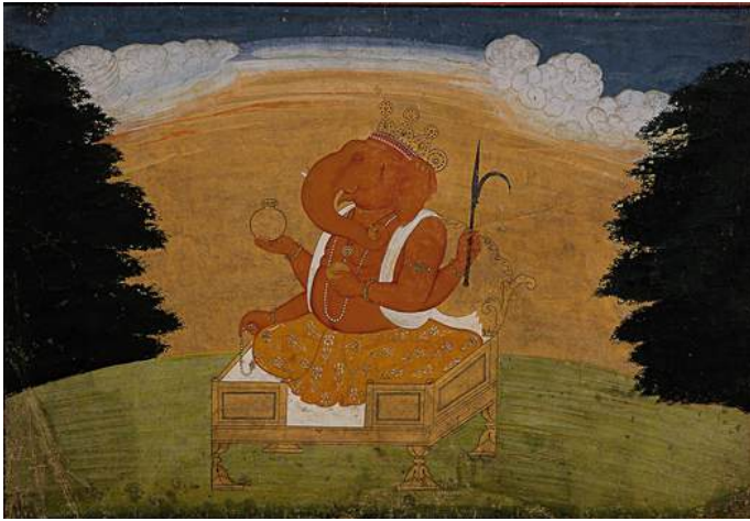
Fattu (ca. 1725–1785) (attribuito), Ganesha, Frontespizio di una serie di Bhagavata Purana, India, regione di Pahari, 1770–80, Museo Rietberg, Collezione Eberhard e Barbara Fischer, inv. n. REF 45, In prestito permanente da Eberhard e Barbara Fischer