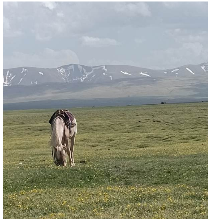
Sulle praterie del Kirghizistan