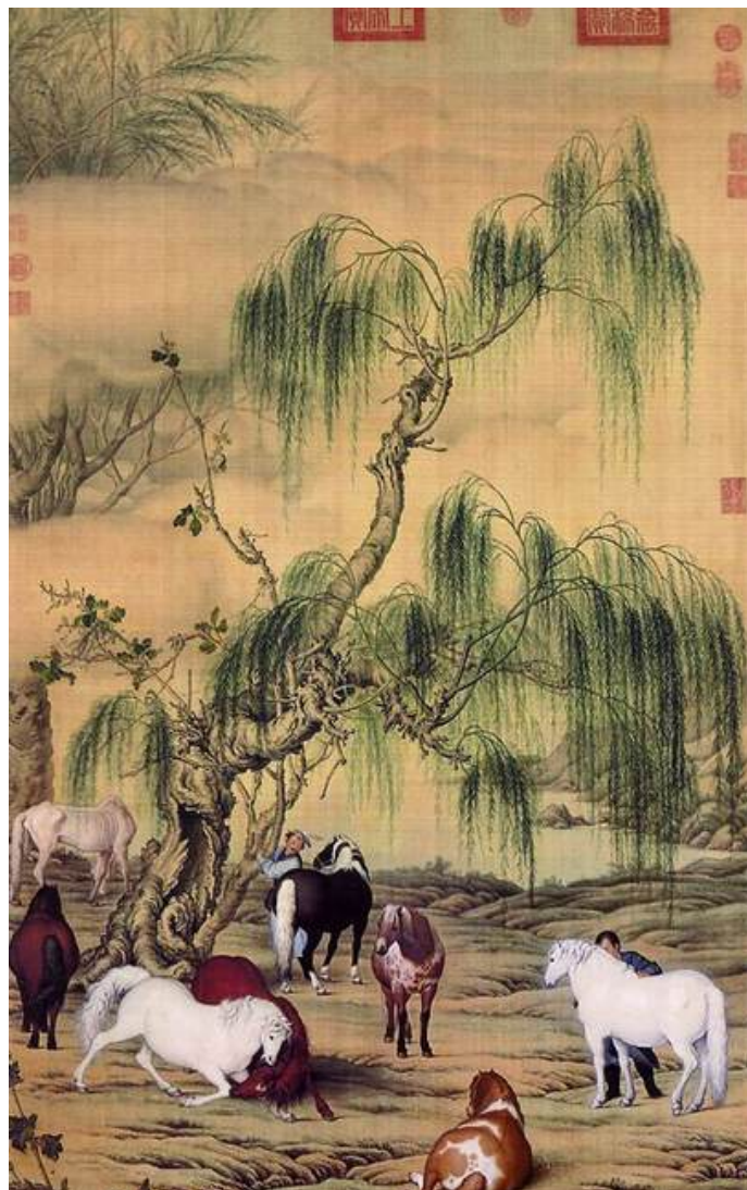
G. Castiglione, Gli otto destrieri, Museo Nazionale di Taipei.