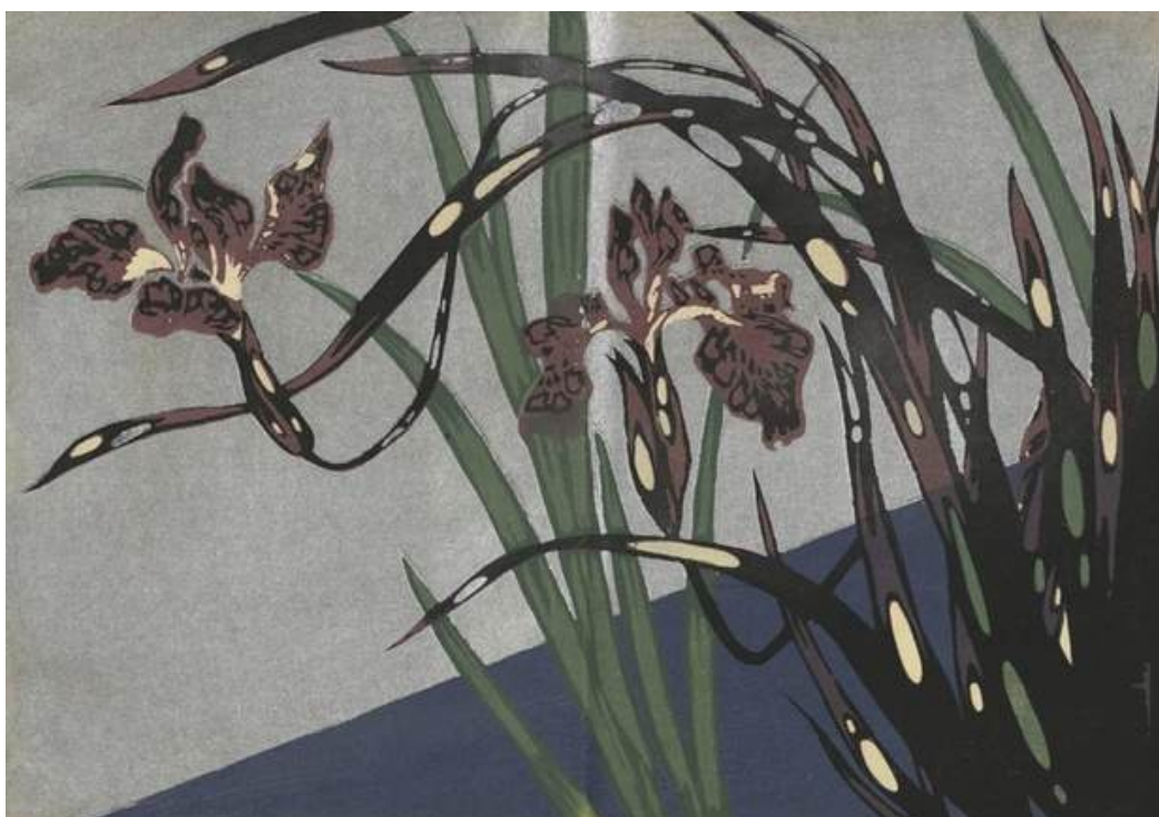
6 - Furuya Kōrin, "Motivi decorativi di erbe e fiori disegnati dal vero (Shasei sōka moyō)", 2 volumi, silografia policroma, Unsōdō, Kyoto, 1907 (Meiji 40) Biblioteca Civica di Varese.

che si ringrazia per la cortesia (vedi Pagine Zen n. 125).