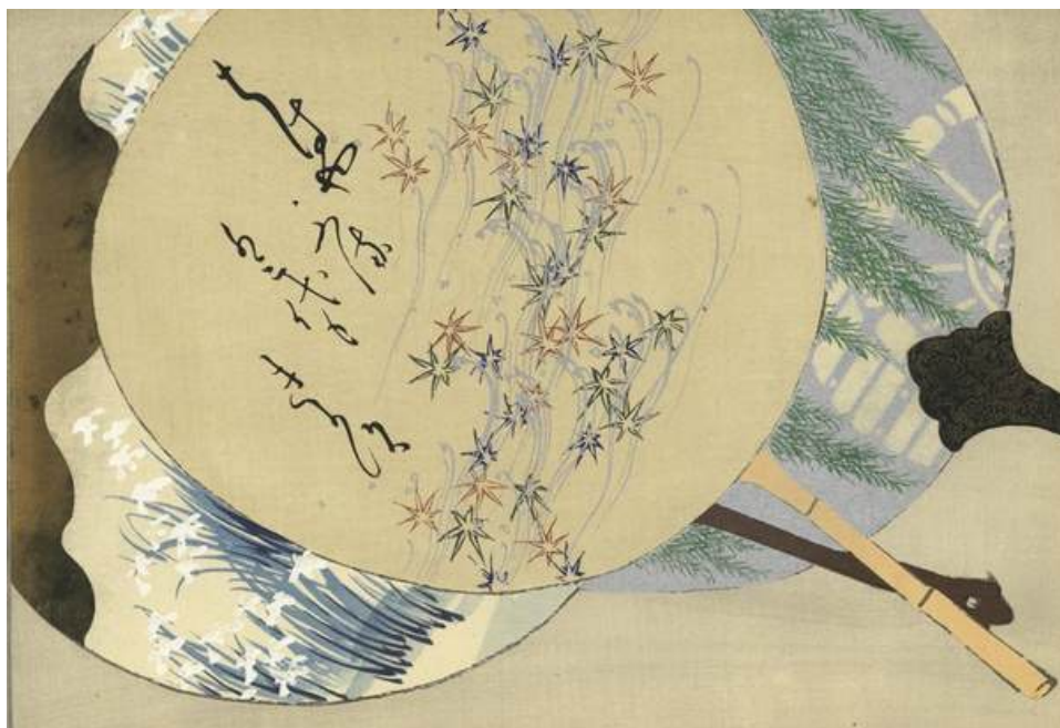
4 -Kamisaka Sekka, "Mille erbe [Cose di tutti i generi] (Chigusa)", volumi 1 e 2, silografia policroma, Unsōdō, Kyoto, 1903 (Meiji 36) Biblioteca Civica di Varese.

Con l'epoca Meiji, la spinta verso l'industrializzazione, il miglioramento tecnologico, la produzione e il commercio ebbero riflessi ancora più importanti sulla produzione editoriale, tanto che gli editori coinvolsero artisti e disegnatori sempre più noti e specializzati per realizzare libri e riviste al passo coi tempi.